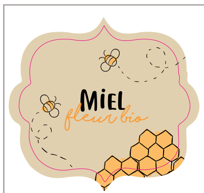
DÉCOUPE À LA FORME