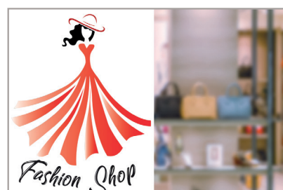
BLANC DE SOUTIEN TOTAL

Il permet l'obtention de couleurs plus profondes et moins opaques sur support transparent. La couche de blanc de soutien se situe sous l'encre utilisée pour l'impression de votre visuel. Les éléments en blanc de soutien doivent être sur un second calque appelé " WHITE ", vectoriel, en CMJN, CYAN 100% (C=100 M=0 J=0 N=0), en ton direct et au premier plan.