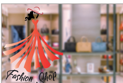
BLANC DE SOUTIEN SELECTIF