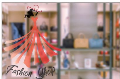
SANS BLANC DE SOUTIEN